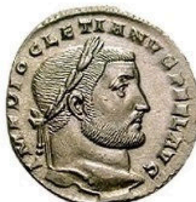
Follis - 5-12g, 26 mm 294-310 AD