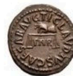
Quadrans - 4g, 12-18 mm; BC-138-161 AD