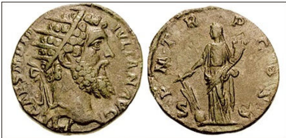
Dupôndio de Dídio Juliano