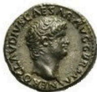
Semis - 4g, 15-20mm 23 BC to 117-138 AD