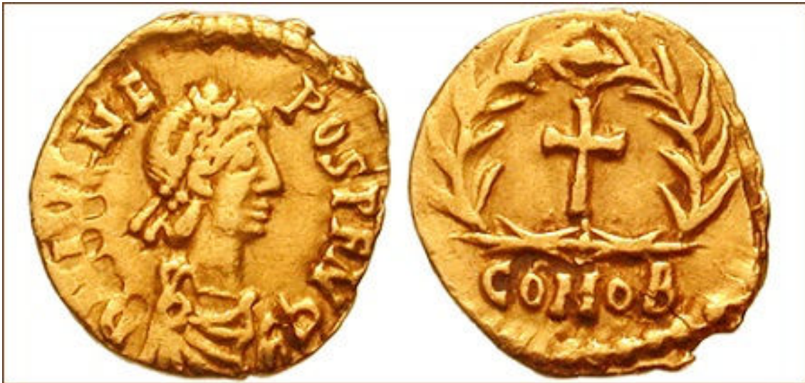
Tremisse de Júlio Nepos (474-480, mesmo estando exilado de Roma depois de 475)