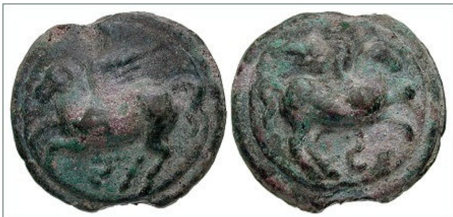
Semisse de bronze (270 AC) – Pégaso voando em ambos os lados da moeda, com a letra 'S' abaixo de ambos os Pégasos. Peso: 178,46 gr.