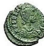
AE4 0.5-1.5g, 14mm 383-400 AD