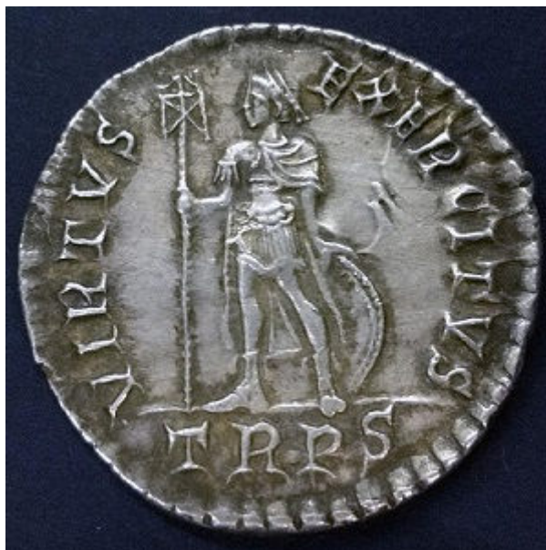
Imagem acima: Moeda miliarense romana de Valentiniano I (r. 364-375 DC) com o símbolo da casa da moeda TRPS. TR indica a casa da moeda (Treveri – Trier, Alemanha) e PS indica a pureza da prata. A moeda foi chamada de ‘VIRTUS EXERCITUS’ (Virtude do exército).