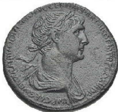
Sestertius - 20-30g, 35 mm 23 BC-250 AD