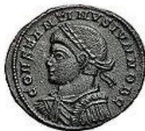
AE3 2-4g, 18 mm 315-400 AD