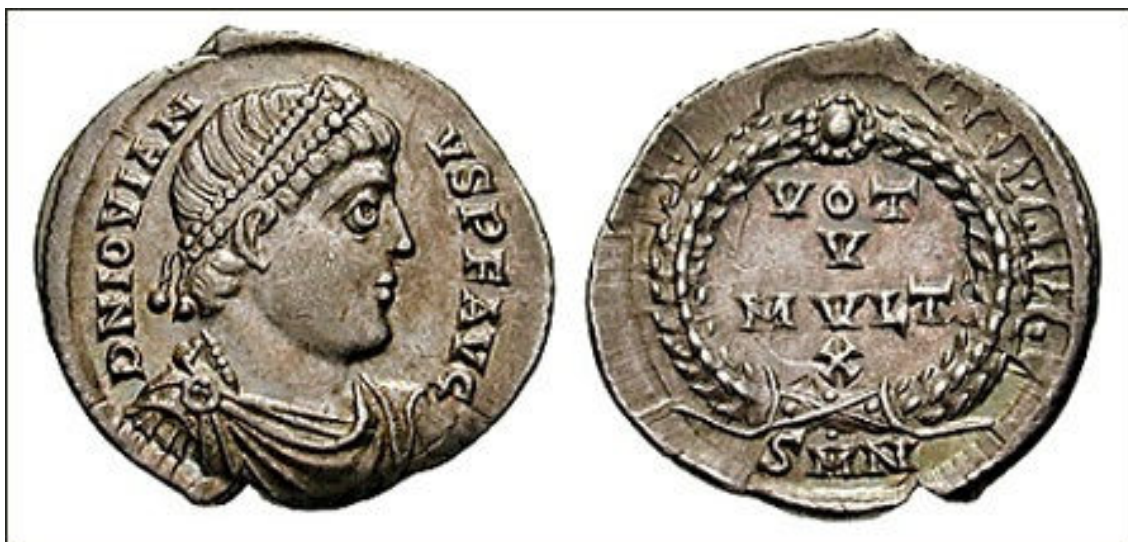
Siliqua de Joviano; 1-3g; 18 mm – wikipedia.org

Siliqua (plural siliquae) é o nome moderno dado para moedas romanas de prata, pequenas e finas, produzidas no século IV DC e que, provavelmente, circulou até o século VII. Quando as moedas estavam em circulação, a palavra latina ‘siliqua’ era uma unidade, talvez de peso definido por um escritor romano tardio como 1/24 de um sólido romano.