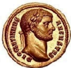
Aureus - 7g., 20 mm 200 BC-305 AD