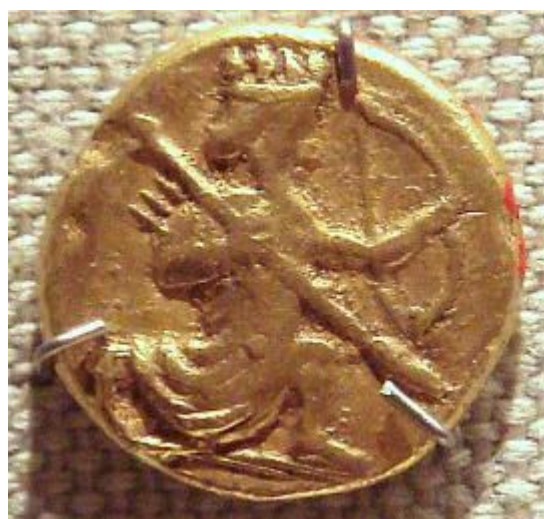
Dárico do tempo de Dario I a Xerxes I e o Dárico do século IV AC