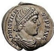
Siliqua - 1-3g, 18 mm 310-650 AD