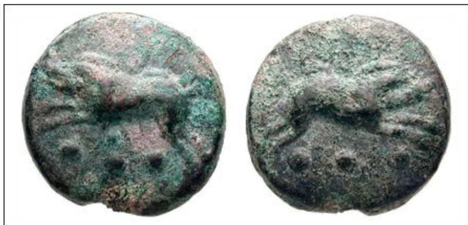
Aes Grave – Quadrante – 275–270 AC

O quadrante (em latim: quadrans, ‘um quarto’; em Grego: kodrantes, κοδράντης) era uma moeda romana de bronze baixo valor, equivalente a 1/4 de asse. Ele foi cunhado em moedas de bronze durante a República Romana com três pequenos pontos ou ‘pastilhas’, representando três úncias (1 ‘unciae’ = 1/12 do asse), como marca de seu valor e eram, por isso, conhecidas também como terúncio (teruncius, ‘três úncias’). Em Mc 12: 42, quando a viúva pobre deu ‘duas pequenas moedas’ (em grego: λεπτά lepta; singular: λεπτόν lepton) ao tesouro do Templo, este valor representava um quadrante.