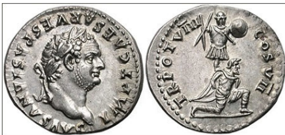
O Denário de Tito Flávio Vespasiano Augusto (79-81 DC), filho de Vespasiano