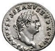
Denarius - 3g, 19 mm 211 BC-241 AD