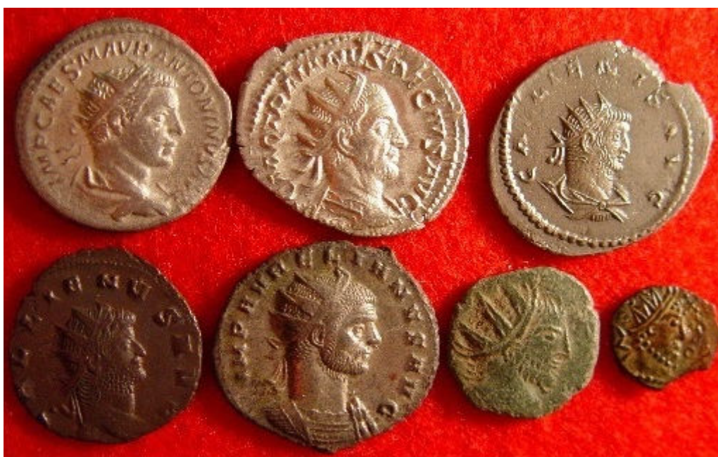
O sete antoninianos

‘Caracala’ era um apelido referindo-se a uma longa capa gaulesa com capuz que o imperador habitualmente usava. Seu nome de nascimento era Lúcio Septímio Bassiano. Aos sete anos de idade foi mudado pelo seu pai Lúcio Septímio Severo para Marco Aurélio Septímio Severo Antonino para fazer uma ligação fictícia à família do imperador Tito Aurélio Fúlvio Boiônio Árrio Antonino Pio (138-161 DC) da dinastia Nerva-Antonina, uma vez que Septímio Severo era de ascendência berbere, não romana. Depois, seu nome mudou para Marco Aurélio Antonino César, César Marco Aurélio Antonino Augusto e César Marco Aurélio Severo Antonino Pio Augusto até a sua morte. Por causa do seu nome mais conhecido, Marco Aurélio Antonino, a nova moeda foi chamada de antoniniano, embora existam numismatas que dizem que esta é uma designação moderna, não o nome que se usava na época (na verdade, desconhecido). Mesmo após a sua extinção, o denário continuou a servir de unidade de conta no Império Romano.