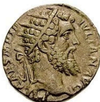
Dupondius - 11-15g, 29 mm 23 BC-250 AD