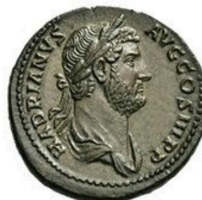
As - 9-12g, 27 mm 280 BC-250 AD

As denominações de moedas mais comumente usadas e seus tamanhos relativos durante a época romana