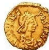
Tremissis - 1.5g, 14 mm; 380-367 AD