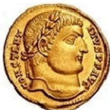
Solidus - 4.5g, 20 mm 310-693 AD