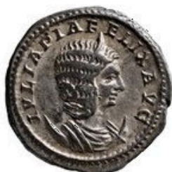
Antoninianus - 2-5g, 18-25 mm, 215 AD