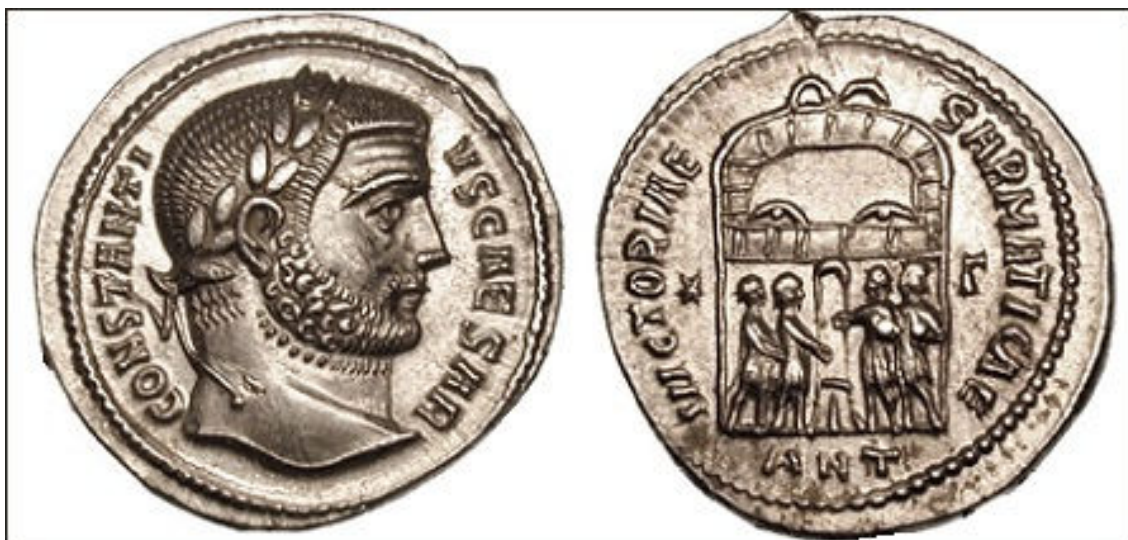
Argento de Constâncio Cloro