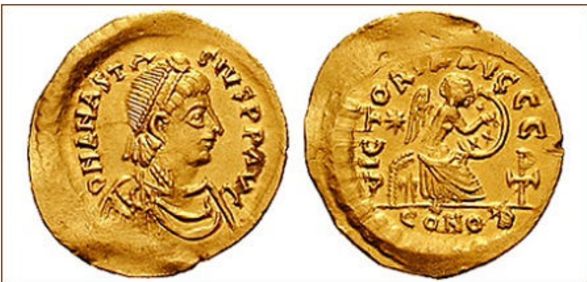
Semisse de Anastácio Dicoro I (491-518) – Imperador Bizantino