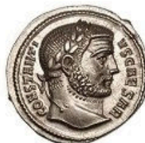
Argenteus - 3,36 g 294-310 AD