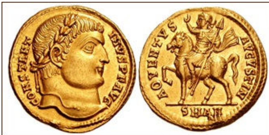
Sólido de Constantino I cunhado em 324 ou 325 DC

O soldo apresenta um diâmetro maior e é menos espesso do que o áureo. O termo bezant (do francês antigo ‘besant’; do latim, aureus bizantino) foi usado na Idade Média na Europa Ocidental para descrever várias moedas de ouro do leste, todas derivadas do sólido romano. Até o fim do Império Romano do Ocidente, as moedas básicas em circulação eram o soldo (solidus) de ouro e algumas moedas menores de bronze. A moeda romana ‘soldo’ ou ‘sólido’ deu origem à moeda de prata italiana medieval ‘soldo’ (plural soldi), com o significado de ‘dinheiro’. Também gerou a palavra ‘soldado’ (‘homem de guerra’), ‘sueldo’ (espanhol medieval) e ‘soldo’ (‘remuneração por serviços militares’) em português, que significa salário, pois era a moeda com a qual os soldados romanos eram pagos. Constantino deixou de cunhar o argenteus de prata de Diocleciano logo após 305, enquanto a moeda cunhada com o billon continuou a ser usado até 360.