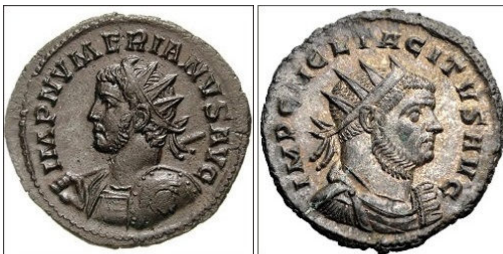
Antoniniano de Numeriano e Tácito

como o sestertius, ou com a inclusão de cobre e estanho de maneira a formar um ‘billon’ (uma liga com baixa quantidade de metal precioso) de aparência semelhante à prata. Na imagem abaixo (chamada de ‘os 7 antoninianos’), é interessante notar na 2ª linha que as duas últimas moedas são um tanto diferentes e são chamadas de ‘barbarous radiates’, em latim. ‘Barbarous radiates’ são imitações do antoninianus, assim chamados devido ao seu estilo bruto e coroa radiada proeminente usada pelo imperador. Foram emitidas a nível privado, principalmente durante a Crise do Século III (235-284 DC) nas províncias ocidentais. Elas não são geralmente consideradas como falsificações, uma vez que eram menores e mais rudes do que as padronizadas emitidas e dificilmente enganavam alguém. Provavelmente eram usadas como trocado no uso diário.